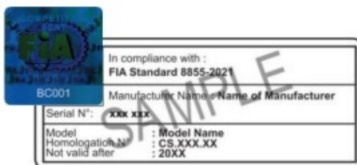
Fig.1. Modèle d'étiquette